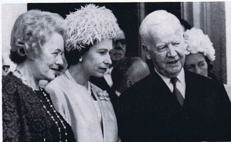
Königin Elisabeth II. in der Villa Hammerschmidt mit Bundespräsident Heinrich Lübke und Frau Wilhelmine Lübke (zu: Elisabeth II. in Deutschland , S. 17)